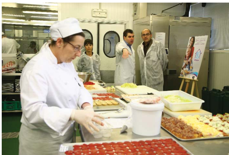
En la imagen, las instalaciones de Iruña Catering, durante la presentación de Etxejan

Por el momento, responsables del servicio de Lantegi Batuak se encuentran manteniendo reuniones con diversos ayuntamientos de Bizkaia, con los que se está trabajando para llegar a un acuerdo y facilitar el servicio a través de los servicios sociales municipales.