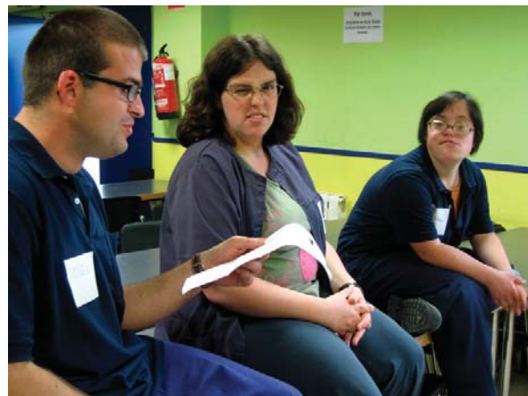
En las imágenes superior e inferior, dos momentos de los talleres en Txibila y Gupost

Al evento, donde se presentaron también los resultados de otras empresas y artistas, acudieron las personas implicadas en el proyecto, con familiares y amigos y compañeros. También tuvimos ocasión de presentar el resultado, en junio, en Barcelona.