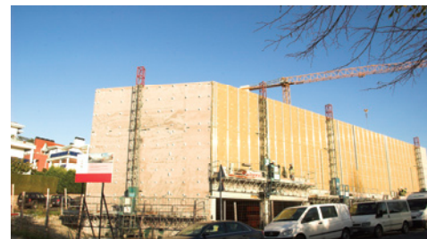
► Estado de las obras del centro