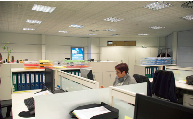
► Interior de la nueva base logística de Servicios medioambientales