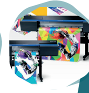
Soluciones gráficas digitales

94 452 38 91 industrial@lantegibatuk.eus