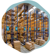
Soluciones logísticas y manipulados